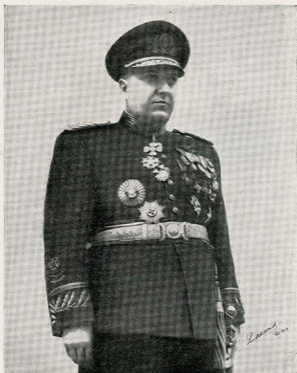
S. Excia. General Angelo Mendes de Moraes, Prefeito do Distrito Federal