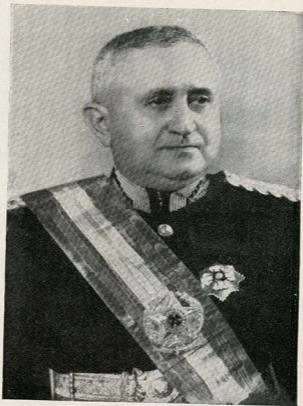
S. Excia. General Eurico Gaspar Dutra, Presidente da Republica dos Estados Unidos do Brasil